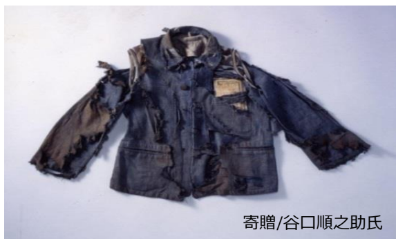
寄贈/谷口順之助氏