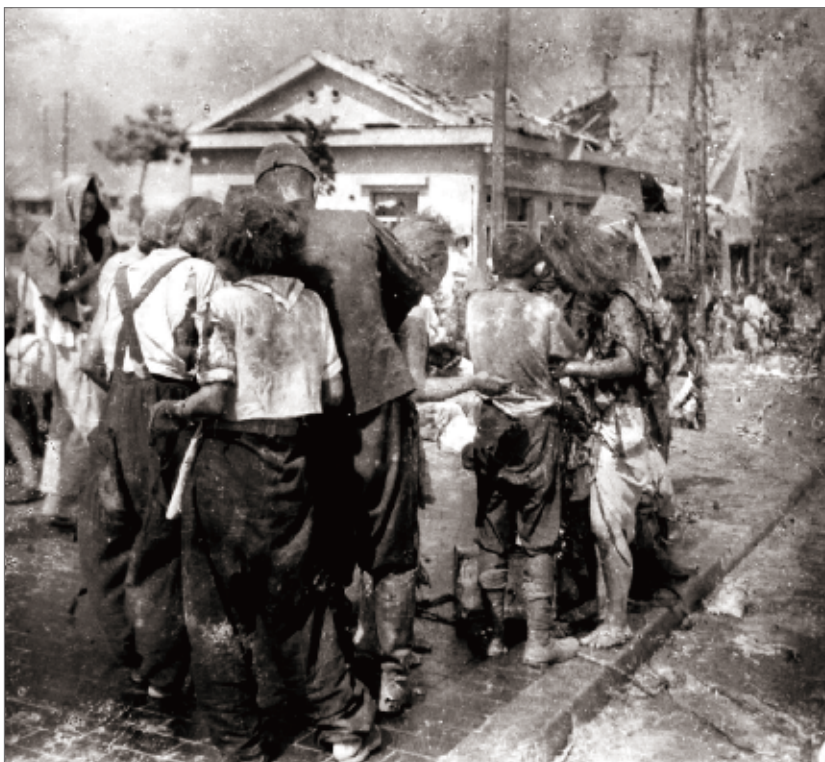
1945年8月6日の御幸橋西詰