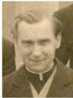
クラインゾルゲ神父