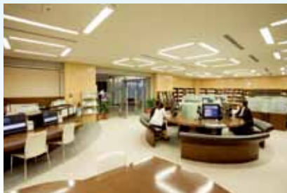
体験記閲覧室【地下1階】

① 収集資料検索装置により、被爆体験記や遺影(写真)、被爆証言、資料動画・静止画などを自由に閲覧・視聴できます。これらの情報は、4か国語(日本語、英語、中国語、韓国語、朝鮮語)で閲覧・視聴できます。