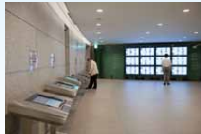
遺影コーナー【地下2階】

① 原爆死没者を静かに追悼し、平和について考える場所です。壁面には爆心地である「島病院」付近から見た被爆後の街並みを、昭和20年(1945年)未までの死没者数(約14万人)と同数のタイルを用いてパノラマで表現しています。