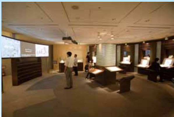
情報展示コーナー【地下1階】