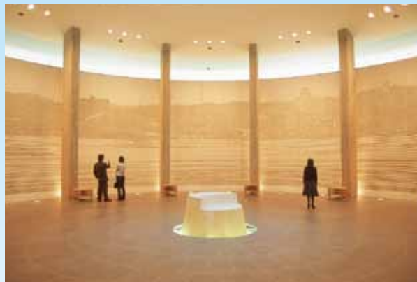
平和祈念・死没者追悼空間【地下2階】

① このコーナーでは、企画展を開催しています。特定のテーマで、被爆体験記を中心に展示を行い、原爆被害の全体像に迫ります。展示解説装置では、被爆体験記に関連した写真などを画面で見ることが出来ます。また、関連する遺品なども展示しています。